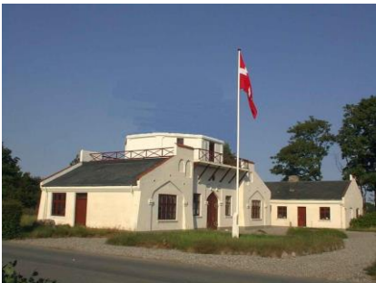
Poul la Cour Møllen