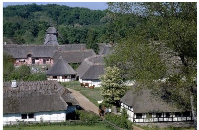
Den Fynske Landsby